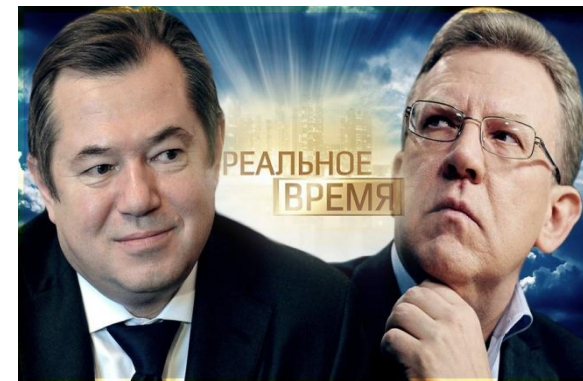
С.Глазьев и А.Кудрин, экономисты в цифровой экономике